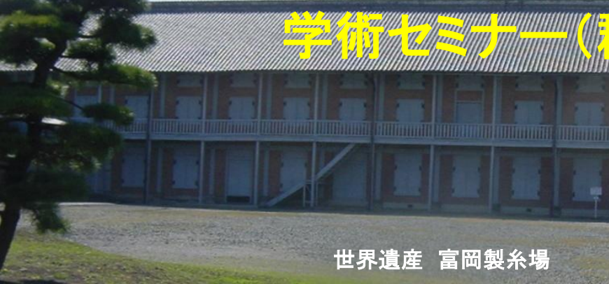
世界遺産 富岡製糸場